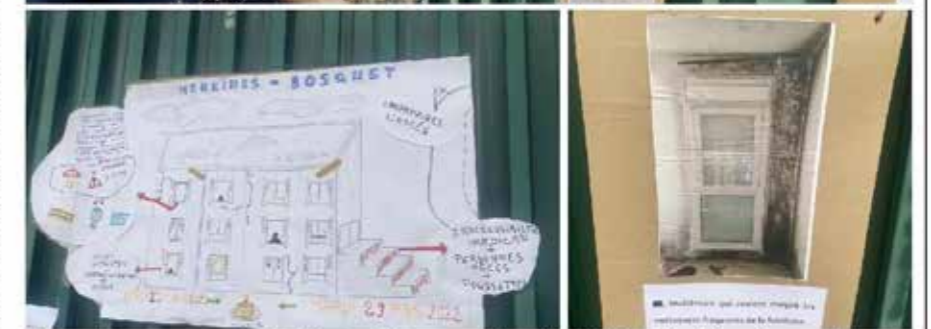
L'exposition conçue par les habitants révèle au grand jour l'état déplorable de leurs logements.